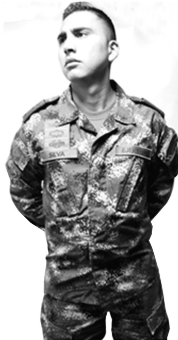
Figura 2. Uniforme y postura militar Consentimiento informado.