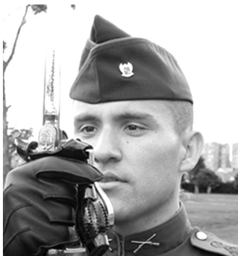
Figura 20. Sable de alférez como símbolo de mando Consentimiento informado.

de que estén sin el uniforme, su fácil reconocimiento, porque la milicia no se puede quitar como si se tratara de una prenda porque ésta se lleva en la mente y en el cuerpo.