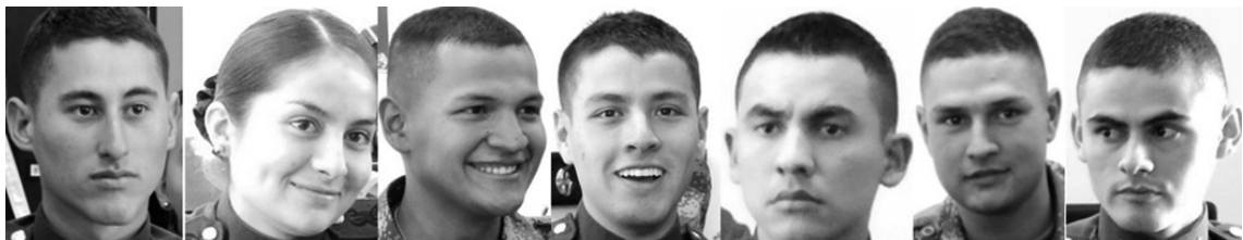
Figura 4. Cadetes en niveles del 1 al 3 Consentimiento informado.

En los primeros niveles de formación se trabajó con jóvenes entre los 16 y los 20 años entre hombres y mujeres (véase figura 4), algunos de ellos con experiencias previas de lo que sería el Ejército, como la participación en colegios militares y la prestación del servicio militar, otros con familiares militares y unos últimos con referentes muy diversos de lo que era la milicia. Sin importar el conocimiento que todos tenían previamente de la institución por los diferentes canales de información, todos coincidieron en que la vivencia de la experiencia fue algo que nunca imaginaron así.