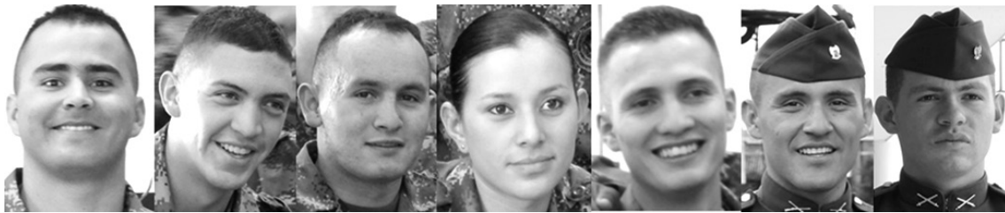
Figura 10. Últimos niveles de formación Consentimiento informado.

dentro del Ejército es el ejemplo y no quieren que su imagen se desprestiege frente al personal que tienen a cargo. El don de mando termina el proceso de evolución corporal de los cadetes que utilizan la expresión corporal, los movimientos y las formas de ser como vehículos de comunicación para con sus colegas y cadetes (véase figura 11).