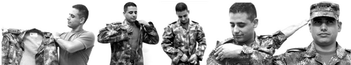
Figura 16. Uso del uniforme militar Consentimiento informado.

El símbolo por excelencia de un militar podría decirse que es el uniforme, este con unas maneras propias de llevarlo que se enseñan en los primeros momentos de la formación. Una de las maneras correctas de llevar el uniforme implica la limpieza de este y además la limpieza individual que hace parte de la estética militar (véase figura 15). El uniforme militar es tan importante porque es lo que recubre el cuerpo, es el que representa a la institución no a un sujeto. El uniforme condiciona la utilización del cuerpo, lo moldea y se hace parte de la identidad de quien lo usa, tanto así, que algunos cadetes manifestaron sentirse raros cuando se veían de civil .