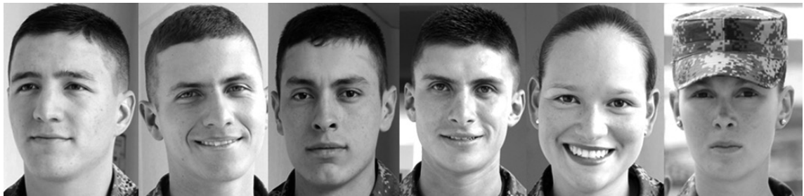
Figura 9. Alféreces, niveles del 7 al 8 Foto: ESMIC, 2014. Consentimiento informado.

La evolución es un concepto tomado de la biología que mide los cambios de estados por parte de los seres vivos que se modifican para la adaptación a su entorno, para este caso, los cadetes cambian en todas sus dimensiones para poder entrar a una sociedad militar que implica una alta exigencia. Esta evolución, no funciona desde el significado netamente biológico, ya que la adaptación y los cambios tienen un gran componente social desde el que cambian y desde el cual los cuerpos son evaluados. Por esto se habla de evolución de los cadetes cuando estos se transforman para alcanzar las exigencias de la apropiación del oficio militar.