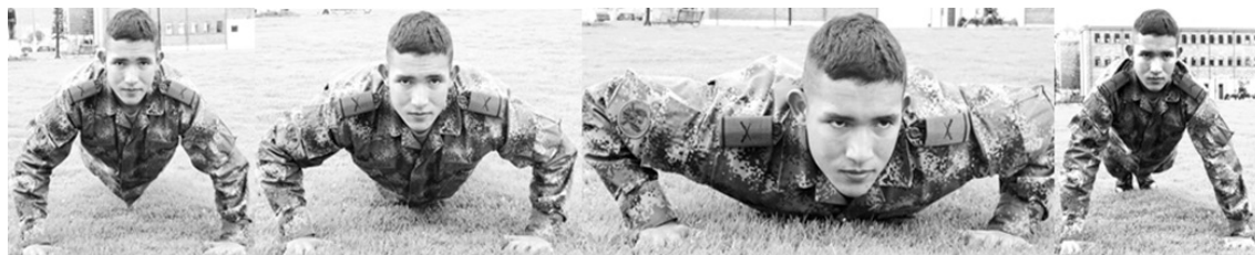
Figura 17. Flexiones de brazos Consentimiento informado.

Parte del honor del cadete esta en buscar en la disciplina del cuerpo la superación del espíritu, esta disciplina del cuerpo es asociada sobre todo al ejercicio que durante los cuatro años de formación los cadetes deben realizar. Algunos cadetes terminan su carrera detestando el ejercicio pero también existe una cantidad considerablemente amplia que termina su paso por la ESMIC con la rutina de actividad física tan interiorizada que la practican sin supervisión (véase figura 17).