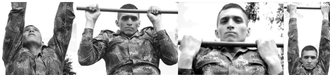
Figura 18. Ejercicio de barras Foto: ESMIC, 2014. Consentimiento informado.

En la ESMIC y otras instituciones, existe una falsa asociación para algunos acerca del significado del ejercicio, por ejemplo dentro de la institución a raíz de que algunas sanciones disciplinarias se penalizan de manera pedagógica a través del ejercicio, muchos cadetes lo piensan como un castigo. El cuerpo es el lugar donde se marca la ley, la superficie sobre la que se escribe y se recuerda al sujeto su lugar social (Clastres, 1978), sus posibilidades de acción y la manera en que debe utilizar su cuerpo de manera correcta en relación con la institución (véase figura 18). Sin embargo las penalizaciones con el ejercicio, contribuyen a la formación corporal como pilar de la vida militar y no solo como elemento de sanción, por esto es importante observar si esta es una de las razones por las cuales algunos oficiales olvidan las rutinas de ejercicio al salir de la ESMIC.