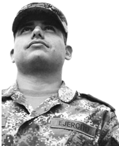
Figura 3. Retórica corporal de la milicia. Consentimiento informado.

El Ejército desde hace unos años ha lanzado campañas propagandísticas importantes, que han permitido contribuir a la construcción de representaciones más acordes con los intereses de la institución, a través de la utilización de diferentes lemas, como el de Los héroes en Colombia sí existen. La comparación que se hace entre los militares y los héroes no es nueva, ya que la milicia se ha asociado históricamente a los personajes de ficción como los súper héroes, este es el caso de Capitán América, por mencionar solo uno.