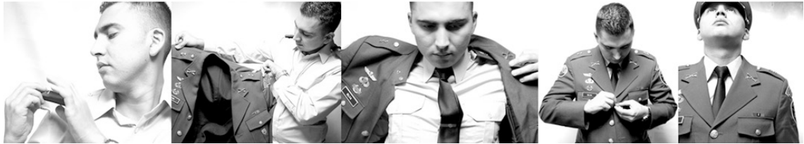
Figura 15. Mística en el porte del uniforme militar Consentimiento informado.

no conocen el nombre de sus compañeros. Entre estas “profanaciones del yo” (Goffman, 1970), está el despedirse de rasgos individuales normales en los jóvenes civiles, como las perforaciones corporales, el pelo largo, tinturado y sobre todo la ropa.