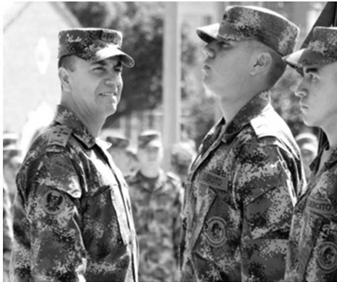
Figura 1. Cadetes en formación.

Consentimiento informado.