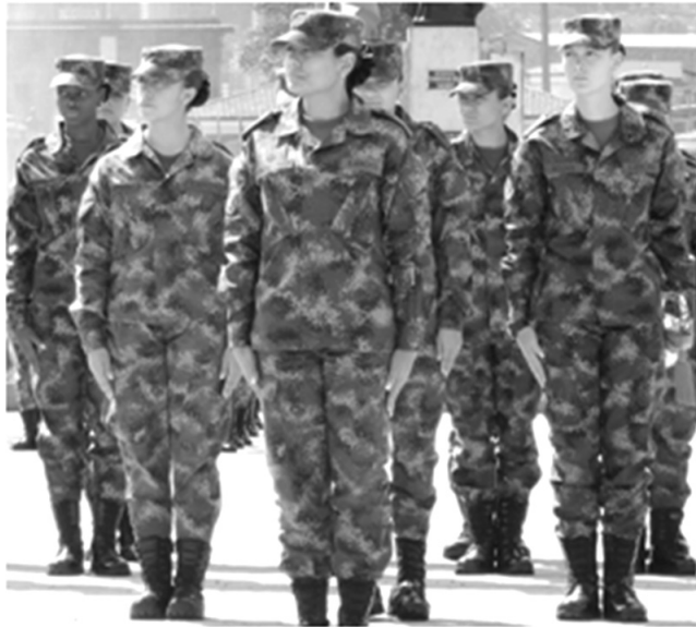
Figura 13. Mujeres cadetes en formación Foto: ESMIC, 2014. Consentimiento informado.

primera herramienta del ser humano: el cuerpo (Mauss, 1971). Los cadetes inician sus modificaciones de esta herramienta humana en el primer momento del proceso de incorporación, de las etapas de inscripción y de presentación de pruebas. Las ansiedades y preparaciones previas a estas pruebas se marcan en el cuerpo donde cada sujeto comprende y habita el mundo (Cabra, 2006).