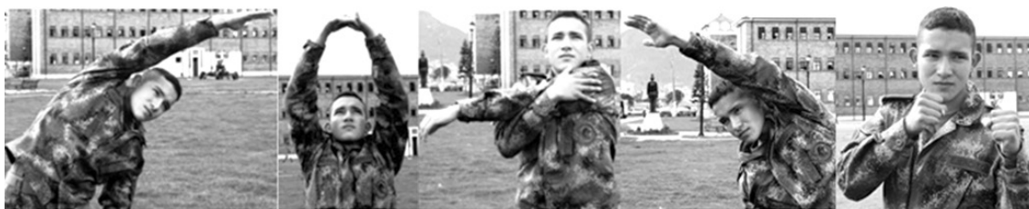
Figura 19. Calentamiento previo a la actividad física Foto: ESMIC, 2014. Consentimiento informado.

Los cadetes que entran a la ESMIC, poseen un cuerpo joven que se encuentra en las últimas etapas de su desarrollo, por lo cual la mayoría ingresan a la institución en una edad liminar en donde los jóvenes se encuentran en el medio de la adolescencia y la adultez, este factor etario es una de las causas de que los cambios se adopten fácilmente en relación al desarrollo físico de los cadetes y también al emocional que forma el carácter y las formas adultas de las personas. La transformación corporal no solo se asocia al envejecimiento normal de una persona en el tiempo, sino que se ve reforzado por la utilización de los espacios que le enseñan a moverse de manera ordenada, las formaciones que obligan a los sujetos a tener una posición erguida, con los ojos al frente y sacando pecho, el uniforme que implica mantener la estética militar, el respeto por los símbolos y la homogenización con sus compañeros y finalmente el ejercicio que aumenta su masa corporal, su percepción de la resistencia corporal, la velocidad y la rapidez de los movimientos (véase figura 19).