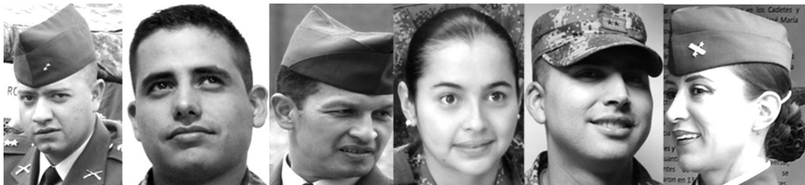
Figura 11. Oficiales militares Consentimiento informado.

dentro del Ejército es el ejemplo y no quieren que su imagen se desprestiege frente al personal que tienen a cargo. El don de mando termina el proceso de evolución corporal de los cadetes que utilizan la expresión corporal, los movimientos y las formas de ser como vehículos de comunicación para con sus colegas y cadetes (véase figura 11).