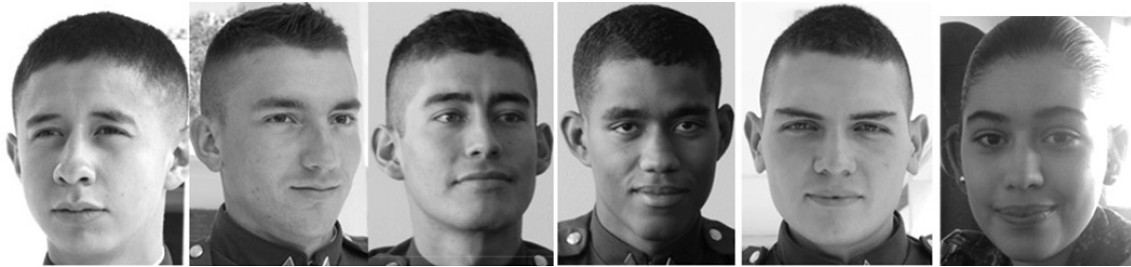
Figura 5. Cadetes en sus primeros niveles Foto: ESMIC, 2014. Consentimiento informado.

La sorpresa que tuvieron con el tipo de experiencia fue un reto para los jóvenes cadetes que continúan con el proceso de formación, sin embargo las condiciones con las que un joven civil choca en la milicia resultan demasiado fuertes para algunos de los compañeros de los actuales cadetes que finalmente decidieron desertar. Algo importante para decir de estos primeros niveles, es que estos hacen parte de los momentos más decisivos la de vida militar, en estos primeros momentos los jóvenes se enfrentan a una gran cantidad de cambios que presionan su autoestima, su carácter, su resistencia física y su capacidad de actuar (véase figura 5).