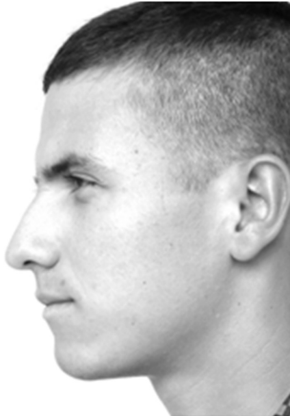
Figura 12. Perfil militar

Es necesario considerar dentro de la preparación del cadete la función de las instituciones en la formación de técnicas y modos particulares de vida. En el caso del Ejército, ésta hace parte de las instituciones totales, es decir aquellas que se convierten en el lugar de residencia y trabajo de un gran número de individuos, donde sus rutinas son administradas formalmente, absorbiéndolos, dándoles un mundo propio, es decir, totalizándolos (Goffman, 1970), bajo esta totalización los cadetes se transforman a la vida militar (véase figura 12).