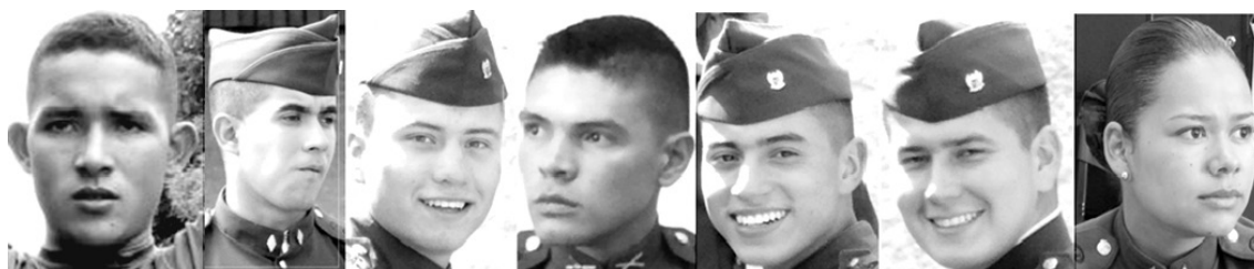
Figura 7. Cadetes en niveles del 4 al 6 Foto: ESMIC, 2014. Consentimiento informado.

Para este punto de la formación los cadetes ya controlan mejor su cuerpo, manejan el cansancio, la actividad física, la división del tiempo y por lo general se mueven con más naturalidad dentro de la institución (véase figura 8). En estos niveles las relaciones entre los cadetes son tan estrechas que muchos han perdido contacto con sus amigos civiles, no solo por la distancia espacial que muchos tienen al ser de otras regiones del país, sino por la lejanía social, que no permite a un civil entender todos los significados de la vida militar que ellos comparten con sus compañeros y amigos de curso.