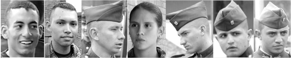
Figura 6. Cadetes en diferentes momentos de su formación Foto: ESMIC, 2014. Consentimiento informado.

todo el manejo de las relaciones que empezaron a tener con sus compañeros de curso. Dentro de la ESMIC, muchas de las actividades privadas en la vida civil se hacen de manera colectiva, como el dormir o el bañarse, esta ruptura entre las formas tradicionales de la vida civil y la vida militar, provocaron en los cadetes unas relaciones demasiado estrechas entre ellos mismos, tanto así que en los primeros meses logran conformarse amistades realmente fuertes que poco a poco desplazan para algunos las relaciones con amigos de la vida civil.