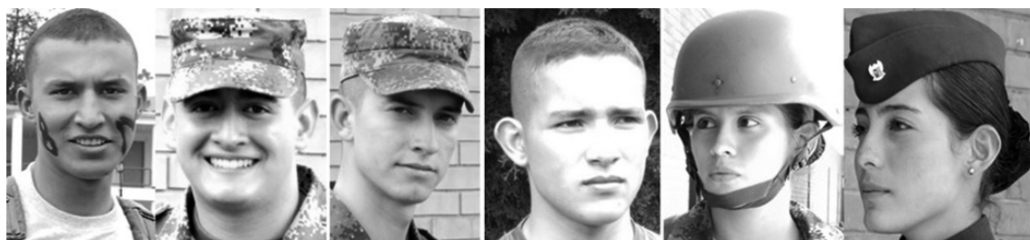
Figura 8. Cadetes en niveles intermedios Foto: ESMIC, 2014. Consentimiento informado.

Para este punto de la formación los cadetes ya controlan mejor su cuerpo, manejan el cansancio, la actividad física, la división del tiempo y por lo general se mueven con más naturalidad dentro de la institución (véase figura 8). En estos niveles las relaciones entre los cadetes son tan estrechas que muchos han perdido contacto con sus amigos civiles, no solo por la distancia espacial que muchos tienen al ser de otras regiones del país, sino por la lejanía social, que no permite a un civil entender todos los significados de la vida militar que ellos comparten con sus compañeros y amigos de curso.