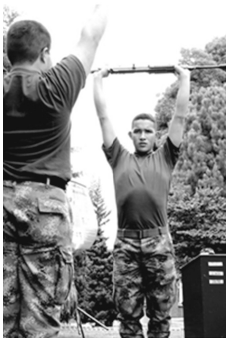
Figura 14. Gimnasia básica militar con armas Consentimiento informado.

Este traspaso de conocimientos en un orden jerárquico propio de la milicia, hace parte del cultivo de una de las virtudes que se desarrollan en el transcurso de la carrera militar, el liderazgo (véase figura 14). Esta virtud es una marca propia de los militares, ya que estos han tenido que decidir, influenciar, dirigir y planear sucesos de los que dependen las vidas de las comunidades, como tratados internacionales, acuerdos políticos y por supuesto guerras.